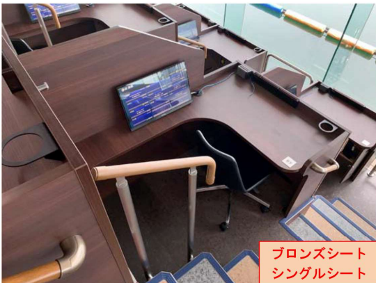
ブロンズシート シングルシート